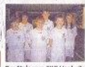
Der Stolz vom SKC Hard, die Jugendmannschaft.