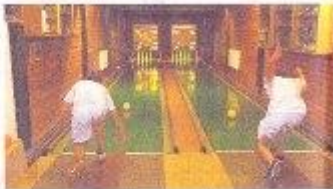
Rasanter Kegelplatz ist in Hard zu bestaunen.

HARD. Der SKC Hard, beheimatet in einem kleinen Ortsteil im südlichen Bereich der Stadt Waidershöfen, war in der vergangenen Saison in der KVOD (Kegelvereinigung Oberfranken/Oberpfalz) das Maß aller Dinge und sorgte mit insgesamt vier Meistertiteln für Aufsehen. Die Rechnung war zusätzlich die Titelgewinnung der 1. Herrenmannschaft in der höchsten Liga der KVOD, der Verbandsoberliga.